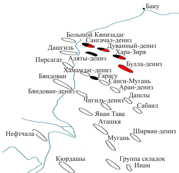
Рис. 1. Положение Хамамдаг-Дениз в структурном плане Бакинского архипелага

Одна из перспективных структур Бакинского архипелага – Хамамдаг-Дениз (рис. 1) – была выявлена в первой половине прошлого века картировочным бурением, а затем более детально изучена структурным и глубинным поисково-разведочным бурением.